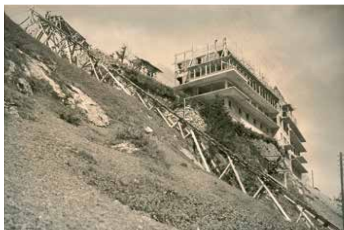
Das Doppelhotel Alpina & Edelweiss während der Bauzeit 1927 Le double hôtel Alpina & Edelweiss lors de sa construction en 1927