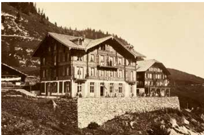
Die Hotels Silberhorn (rechts, 1858 eröffnet) und Mürren (links, 1871 hinzugefügt, mit Querfirst von 1876)