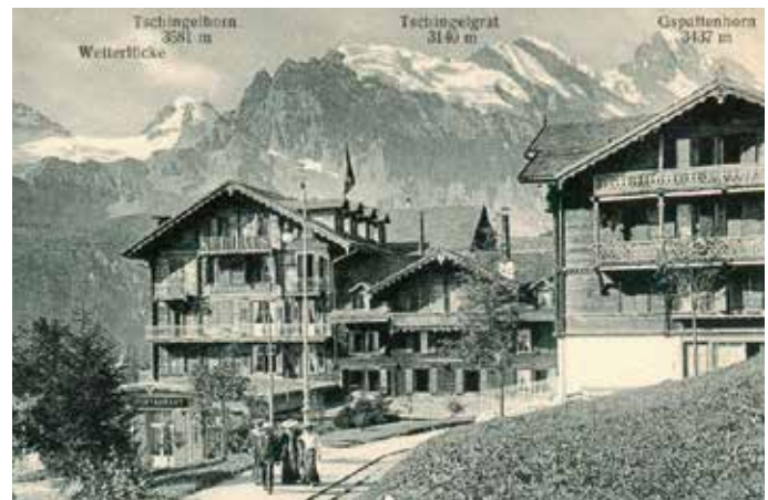
Seit 1894 wurden die Hotelgäste des massiv ausgebauten «Grand Hotel Mürren & Kurhaus» mit dem eigenen Rösslitram abgeholt.

Les Hôtels Silberhorn (à droite, ouvert en 1858) et Mürren (à gauche, ajouté en 1871, avec l'avancée perpendiculaire datant de 1876)