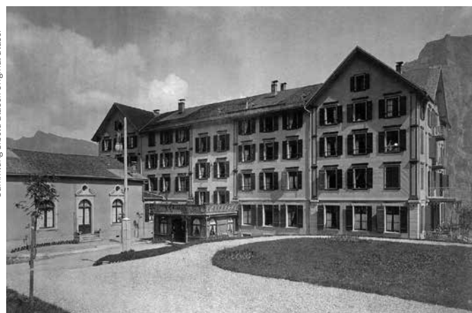
Das «Grand Hotel des Alpes» nach dem Wiederaufbau von 1886 Le «Grand Hôtel des Alpes» après la reconstruction de 1886