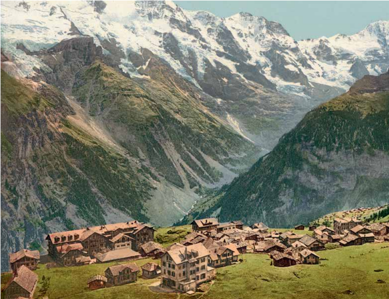
Gesamtansicht des Dorfes Mürren nach 1896 mit den Hotels Grand Hotel und Kurhaus Mürren, Victoria (im Vordergrund), Jungfrau (nebenan), Beau-Site (im Bildhintergrund) und Alpenruhe (rechts aussen)