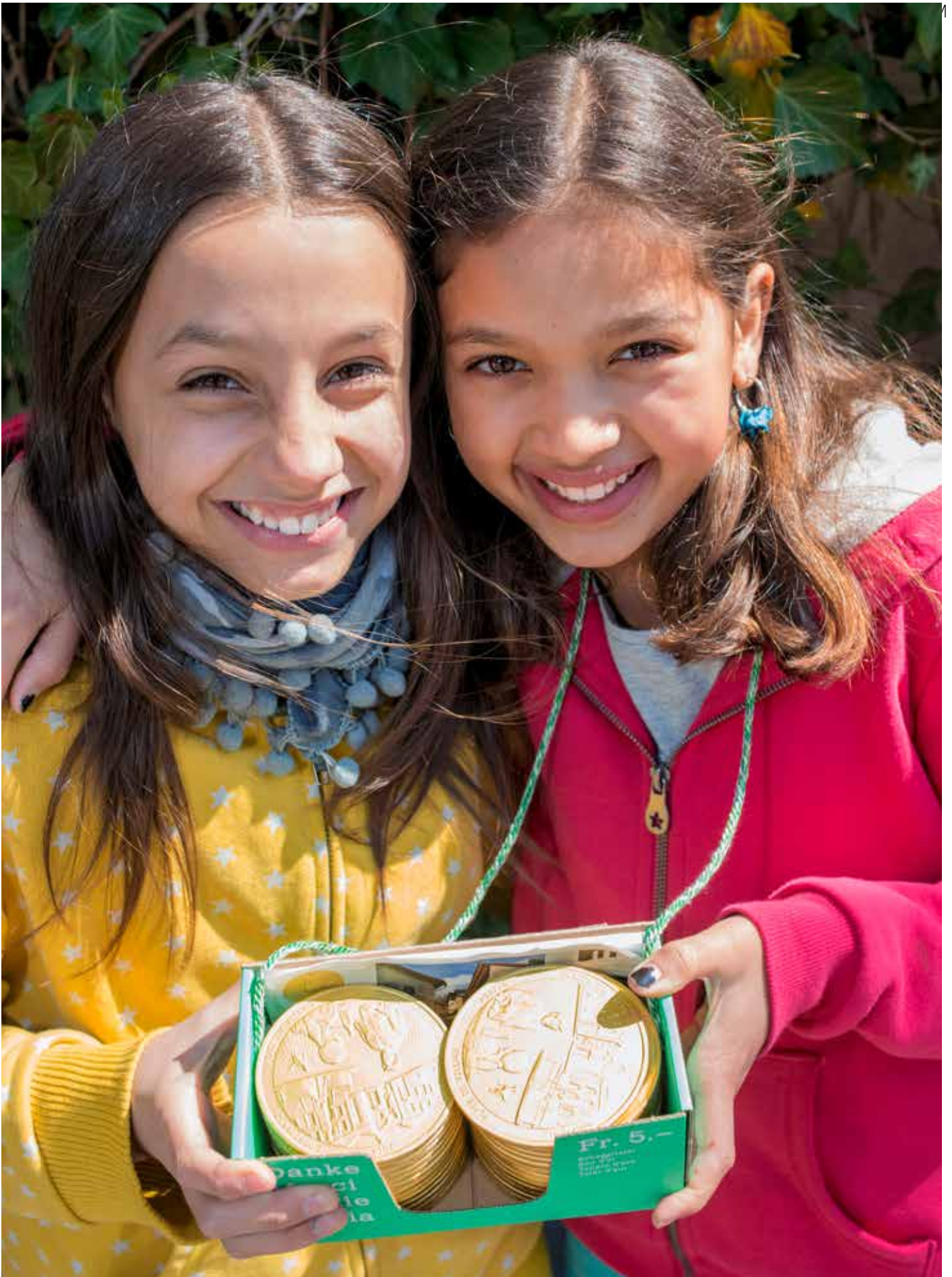
2014 ist der Talerverkauf dem Thema «Dorfplatz» gewidmet. Thème de l'Ecu d'or 2014: «Place du village»