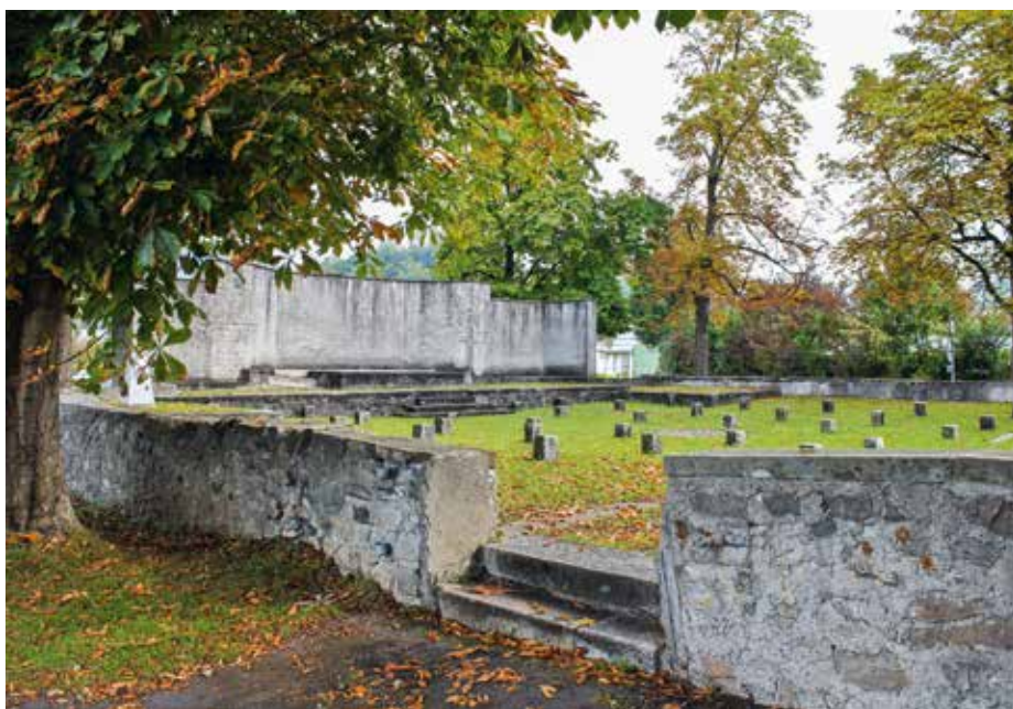
Der Nidwaldner Landsgemeindering in Wil, Oberdorf. Der kaum mehr genutzte Platz ist zum stillen Zeitzeugen geworden. Aufnahme 2014.

La dernière Landsgemeinde de Wil, Oberdorf a eu lieu en 1996 à l'intérieur du mur d'enceinte. On remarque à l'arrière-plan l'une des rampes mobiles installées après l'introduction du suffrage cantonal féminin en 1972/73. Prise de vue de 1994.