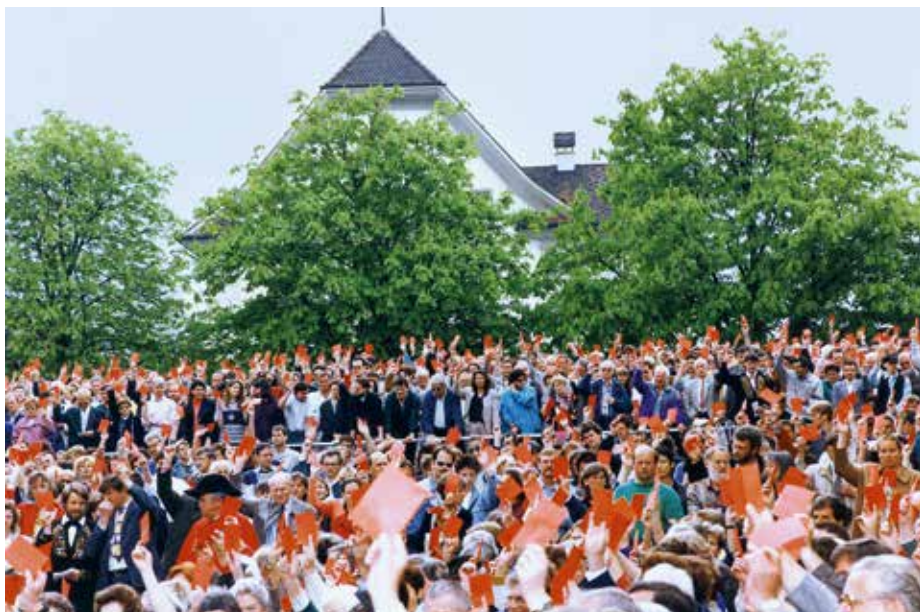
Die letzte Landsgemeinde fand 1996 auf dem Landsgemeindering in Wil, Oberdorf, statt. Im Hintergrund eine der mobilen Stehrampen, die mit der Einführung des kantonalen Frauenstimmrechts 1972/73 eingerichtet wurden. Aufnahme 1994.

La dernière Landsgemeinde de Wil, Oberdorf a eu lieu en 1996 à l'intérieur du mur d'enceinte. On remarque à l'arrière-plan l'une des rampes mobiles installées après l'introduction du suffrage cantonal féminin en 1972/73. Prise de vue de 1994.